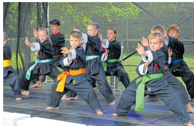
Die jüngsten Sportler der Asia Sport Akademie zeigten, was sie schon gelernt haben.

Das Automobil ist für sein Alter noch tippstark in Ordnung. Falls Ersatzteil benötigt werden, „im Internet ist alles vorhanden“, sagt der stolze Besitzer, der mit seiner Frau sein Fahrzeug nur bei schönem Wetter auf Ausfahrten fährt.